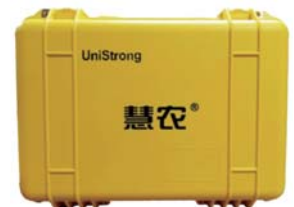
全新设计专属仪器箱